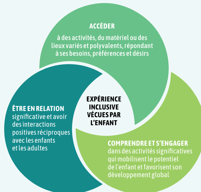
Schéma Expérience inclusive de l'enfant au SGEE 1

La politique d'inclusion du SGEE confirme sa volonté que tous les enfants vivent des expériences inclusives dans leur milieu. Elle permet aussi de circonscrire les actions porteuses et de les faire connaître à tous : travailleuses, parents et partenaires.